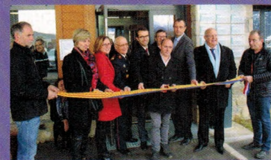
Cette maison de santé a été inaugurée le 22 décembre 2017.

Ouverte en 2016 dans des locaux construits par la mairie, avec le soutien du Département, la patientèle locale et saisonnière est accueillie par une équipe médicale pluridisciplinaire. Grâce à un bureau partagé, la population de cette zone de montagne peut également consulter des professionnels du centre médico-psychologique de Thuir, de la Maison sociale de proximité de Font-Romeu et de la PMI.